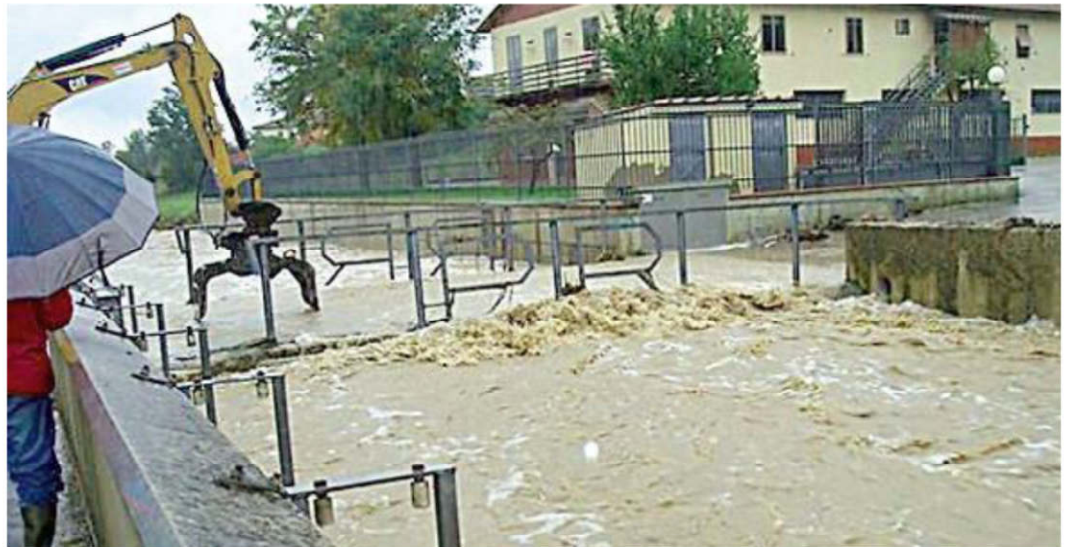
L'alluvione che il 21 ottobre del 2013 causò seri danni anche nel centro abitato di Figline Valdarno